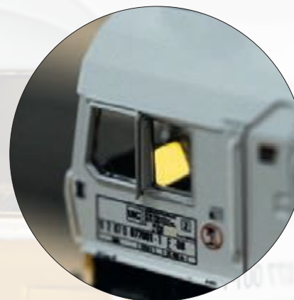
Die Beleuchtung des Steuerpults und des Führerstands sind digital schaltbar

Dieses Modell finden Sie im Märklin HO-Sortiment unter der Artikelnummer 39074.