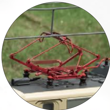
Neu konstruierte Stromabnehmer der Bauart DBS 54 digital heb- und senkbar

In ihrem Typenplan für Einheit-E-Loks definierte die junge Bundesbahn mit der Baureihe 140 eine Maschine für den Güterverkehr. Diese entsprach weitgehend der Baureihe 110, mit einer den Aufgaben angepassten Getriebeübersetzung. Sie kam aber auch vor Personenzügen zum Einsatz und war dank der enormen Stückzahl von 879 Exemplaren omnipräsent. Die Auslieferung begann im Januar 1957. Im August 1973 konnte die DB schließlich die letzte 140 in Empfang nehmen. Folglich gab es viele kleine Bauunterschiede. So erhielten einige Loks Verschleißpufferbohlen und eine Vielfachsteuerung für Doppeltraktion und Wendezugbetrieb. Bei privaten Bahnen sind sie bis heute im Einsatz. DB Cargo verzichtet seit Oktober 2016 auf ihre Dienste.